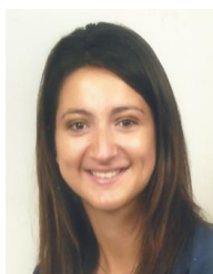
Gabrielle Agnus gagnus@platinum- gestion.fr

C'est notamment dans ce sens et avec prudence que D Trump semble évoluer désormais, au regard de la dernière déclaration de son administration, à savoir, de ne pas désigner la Chine comme un manipulateur de devises, et ainsi éviter la mise en place d'éventuelles sanctions. Un changement d'attitude qui devrait apaiser les tensions liées à la politique protectionniste de D Trump mais qui semble démontrer, une nouvelle fois, la non-concrétisation de promesses de campagne.